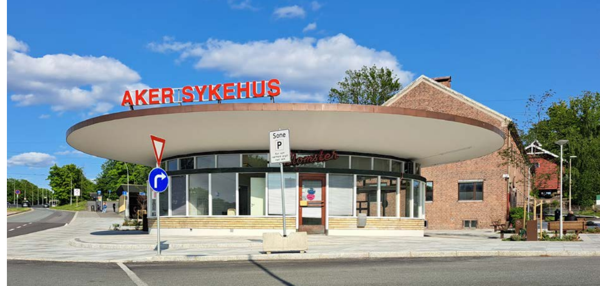
Aker sykehus må utvikles som lokalsykehus for alle de fire bydelene i Groruddalen.

I forkant av høstens valg har våre fagforeninger valgt ut 28 spørsmål som vi har spurt partiene om. Noen av dem er trykket i dette heftet. Du kan lese alle svarene her www.lo-oslo.no/svar .