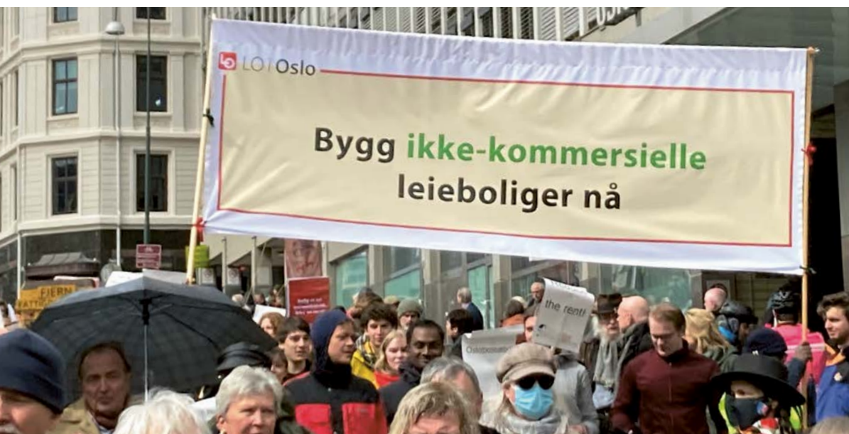
Bygging av ikke-kommersielle boliger var et av LO i Oslos krav 1. mai 2023.

Boligprisene stiger, særlig i Oslo. Tallet på unge som kjøper sin første bolig er rekordlavt, og i leiemarkedet overbyr de hverandre. Inngangsbilletten for bolig er blitt for høy.